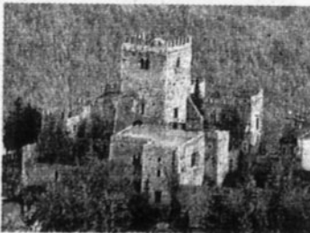
Nelle foto si vedono panorami oppure caratteristiche immagini dei paesi che fanno parte del GAL insieme al presidente ed alla direttrice della sede oltre ai loghi